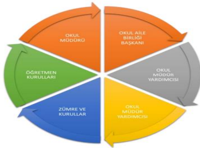
Görsel: Okul Paydaş İlişki Grafiği

Kurumumuzun temel paydaşları öğrenci, veli ve öğretmen olmakla birlikte eğitimin dışsal etkisi nedeniyle okul çevresinde etkileşim içinde olunan geniş bir paydaş kitlesi bulunmaktadır. Paydaşlarımızın görüşleri anket, toplantı, dilek ve istek kutuları, elektronik ortamda iletilen önerilerde dâhil olmak üzere çeşitli yöntemlerle sürekli olarak alınmaktadır.